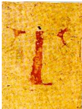
Tauzeichen von Franziskus in der Magdalenakapelle von Fontecolombo

Mehrere Zeugnisse sagen, dass Franz das Tau-Zeichen öfter verwendete: Er zeichnete es auf Mauern, in seine Briefe und mit der Kutte auch auf sich selbst. „Das T war ihm unter allen Buchstaben der liebste; mit ihm unterschrieb Franziskus seine Briefe und schmückte die Wände der Zellen“ (3 C 3).