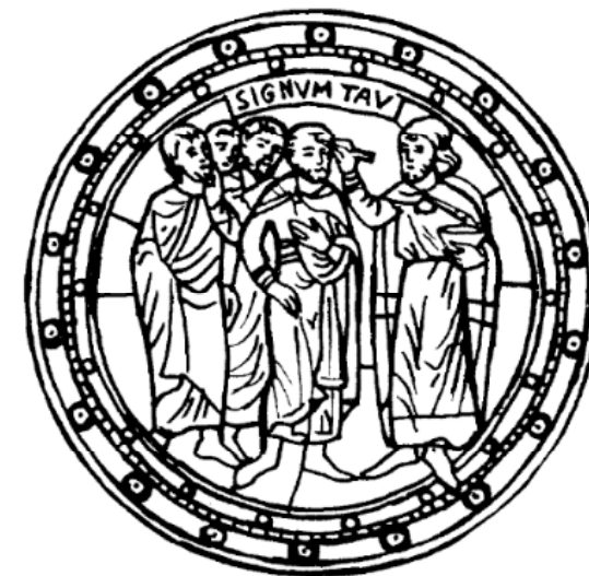
Der Gottesbote bezeichnet Menschen mit dem Tau Glasfenster in Saint-Denis, Frankreich, 12. Jahrhundert

Das hohe Mittelalter greift die biblische Heilsbedeutung wieder auf: Die Kirche möchte ein Ort sein, der Menschen in Gottes Leben eintreten lässt.