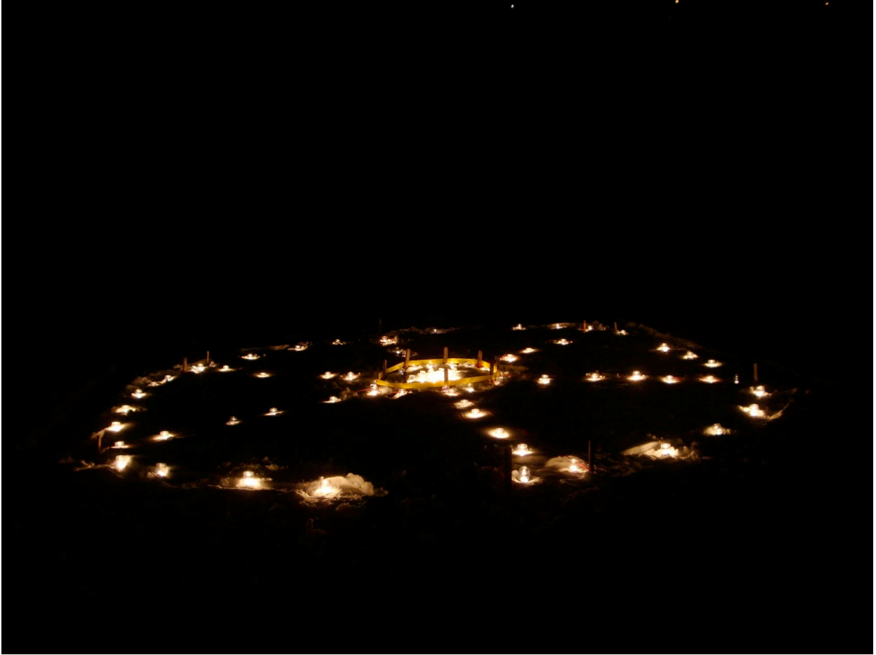
Meditationsrad im Schnee vor der unteren Ranftkapelle 12. Dezember 2009